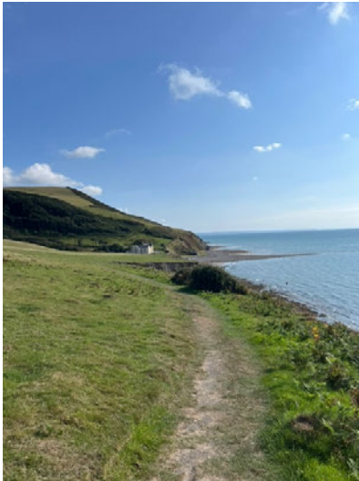
Wales Coast Path

Zum Abschluss noch ein paar Impressionen von meiner Zeit in Aberystwyth: