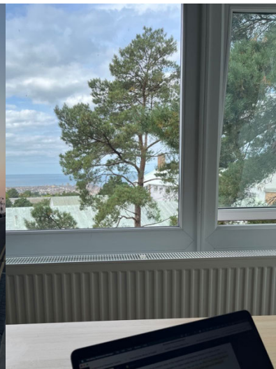
Büro mit Meerblick