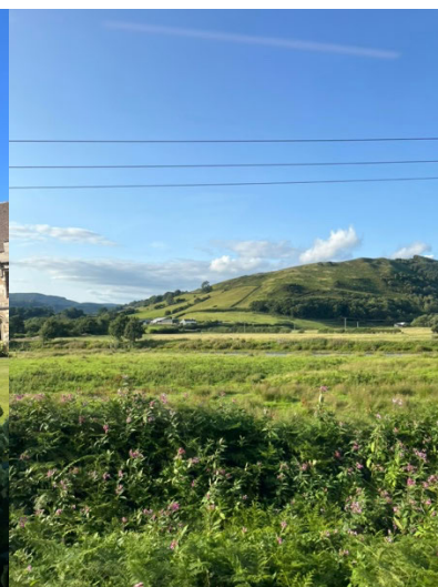
Blick aus dem Zug