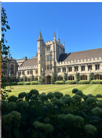
Wochenende in Oxford