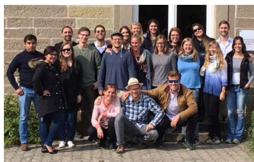
Teilnehmer und Organisatoren der Summer School 2016