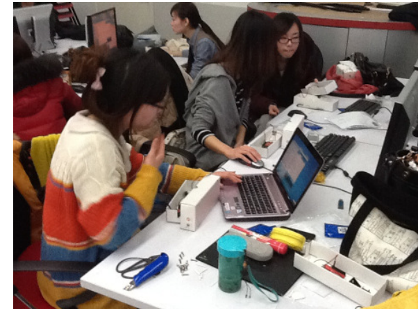
Physical Computing Workshop Tongji-University Shanghai