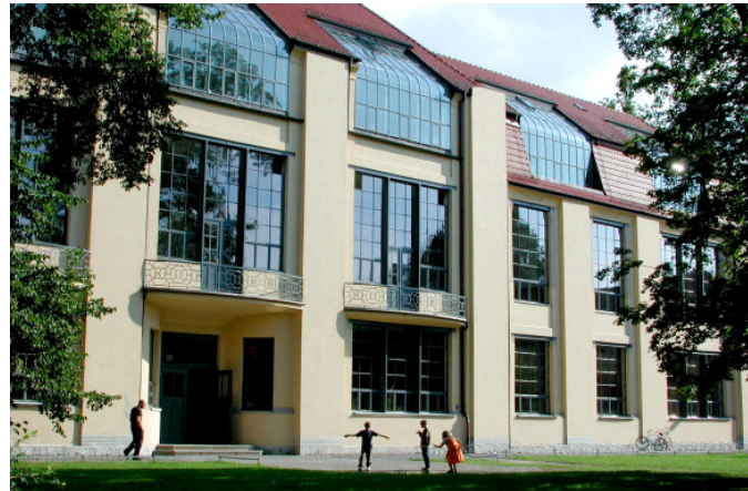
HENRY VAN DE VELDE / School of Art 1904/11 STAATLICHES BAUHAUS / 1919 - 25