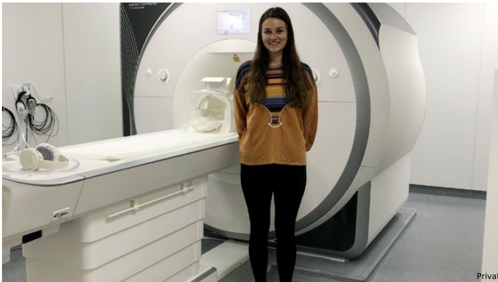
Germany an der Uniklinik der RWTH Aachen