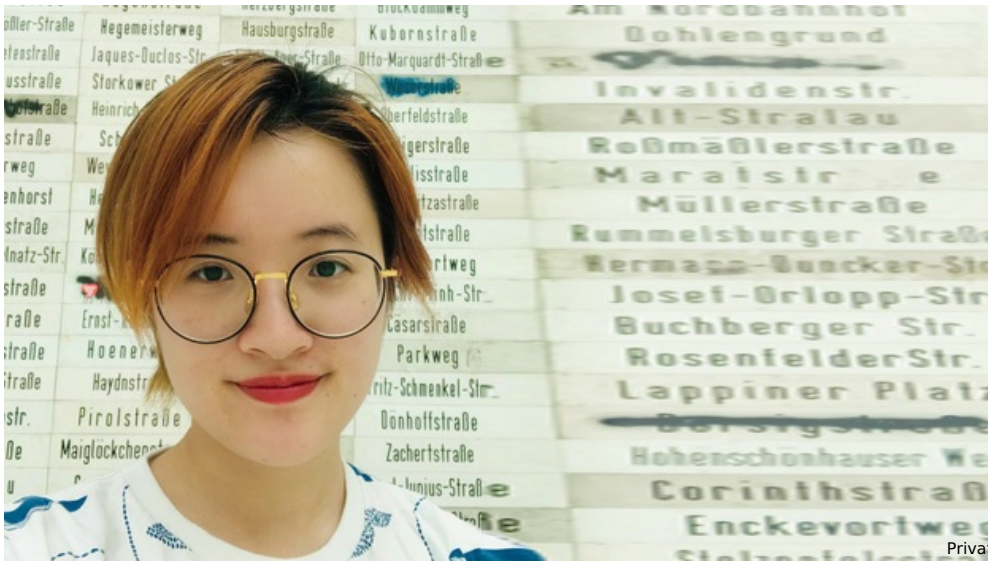
Team der Universitätsklinik Heidelberg mit