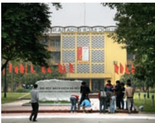
Auf dem Campus: Die Hanoi University of Science and Technology (links) beherbergt auch das Vietnamesisch-Deutsche Zentrum (rechts).