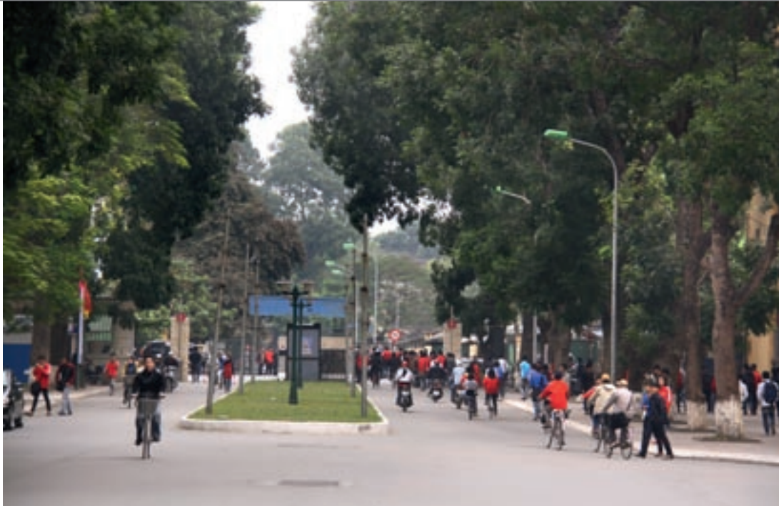
Emsiger Betrieb: Haupteingang der Hanoi University of Science and Technology (oben).